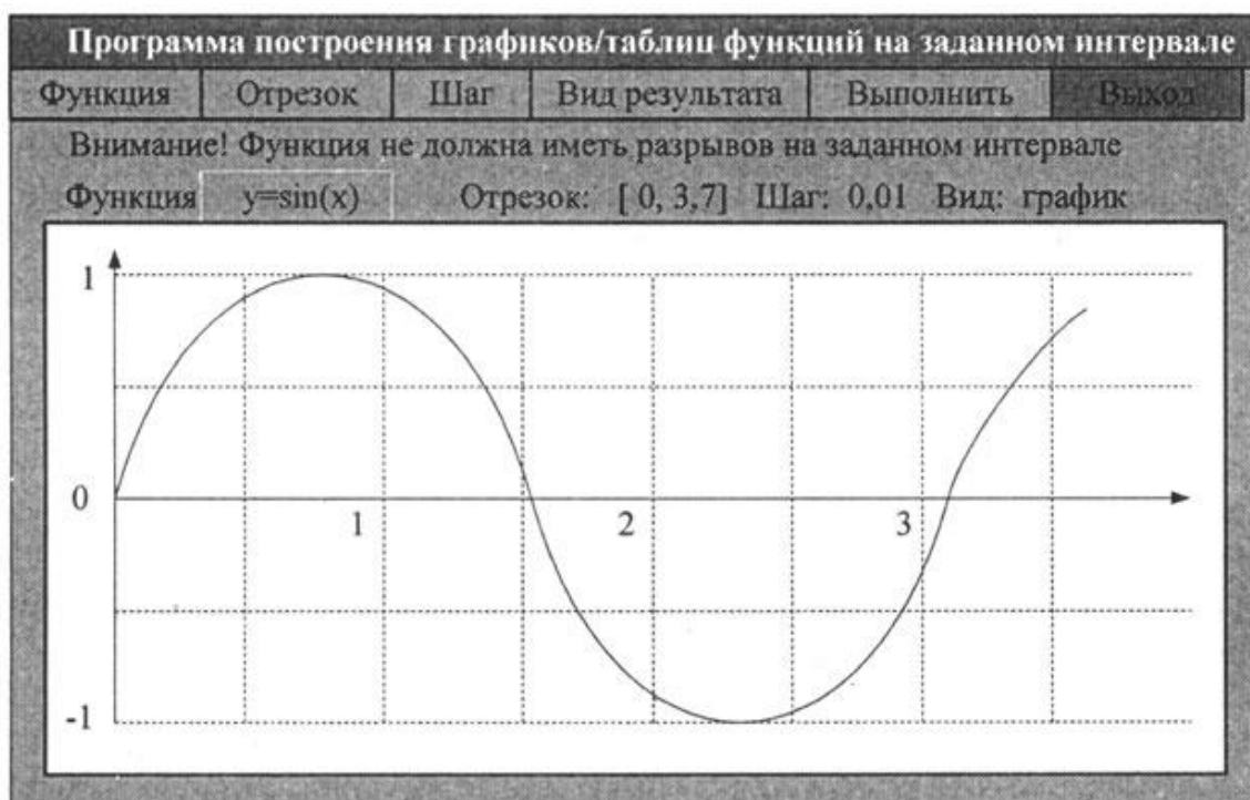
Рисунок . 2.2 - Внешний вид экрана программы построения графиков функций